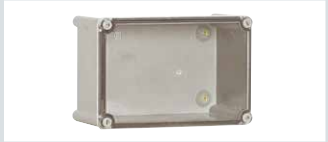
Caja tapa transparente