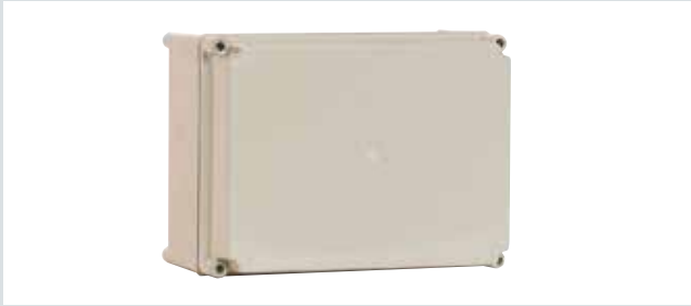
Caja tapa opaca