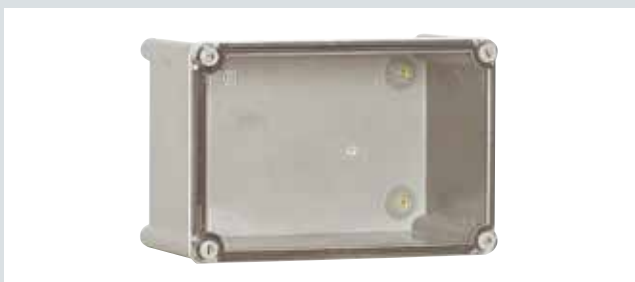
Caja tapa transparente