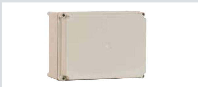
Caja tapa opaca