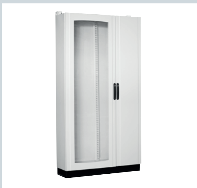
Armario compacto IP55 puerta transparente