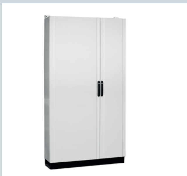
Armario compacto IP55 puerta opaca

Cuerpo reversible para poder instalar el módulo auxiliar a derechas o izquierdas según las necesidades de la instalación.