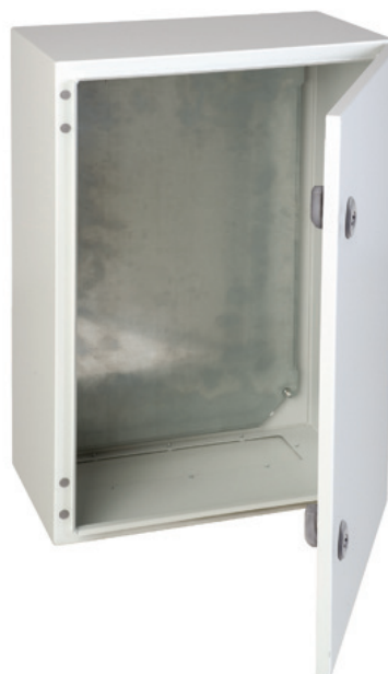
Foto y plano genérico, para consultar plano detallado (pdf, dxf, igs) descargar en www.ide.es

Dimensiones exteriores: (AxBxC) 700x500x250 mm