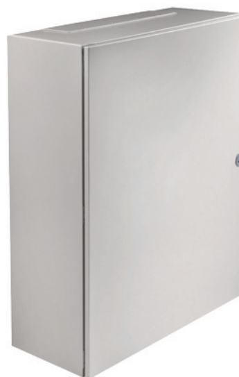
Foto y plano genérico, para consultar plano detallado (pdf, dxf, igs) descargar en www.ide.es

Dimensiones exteriores: (AxBxC) 1000x800x300 mm