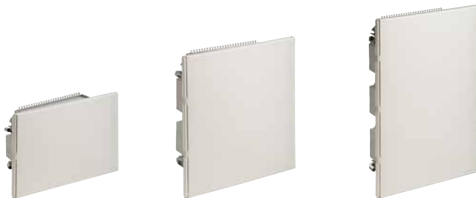
1x14 módulos PH/EM14B0

* Cálculos obtenidos de acuerdo a la norma CEI 890:1997 (incluida corrección 1998). Método para la determinación por extrapolación del calentamiento de los conjuntos de aparamenta de baja tensión y dispositivos de control derivados de serie (PTTA).